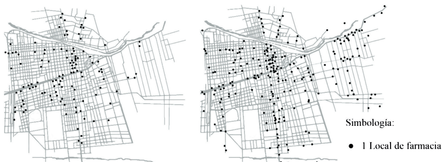
Figura 2. Distribución espacial de boticas en Santiago (1930 y 1950)