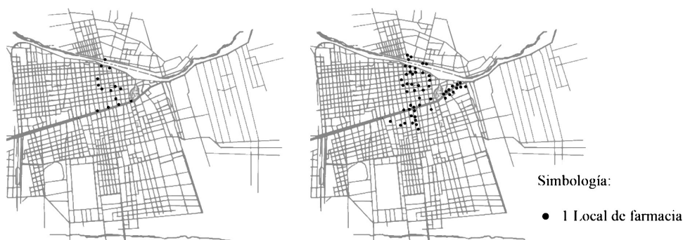
Figura 1. Distribución espacial de boticas en Santiago (1846 y 1882)

Fuente: Elaboración de la autora en base a Oficina de Estadística, Repertorio Nacional . Santiago. Imprenta del Progreso. 1850 y La Época , “Matrícula de las profesiones e industrias sujetas por la lei al pago de las contribuciones de patentes. Departamento de Santiago”, 21 de junio 1882.